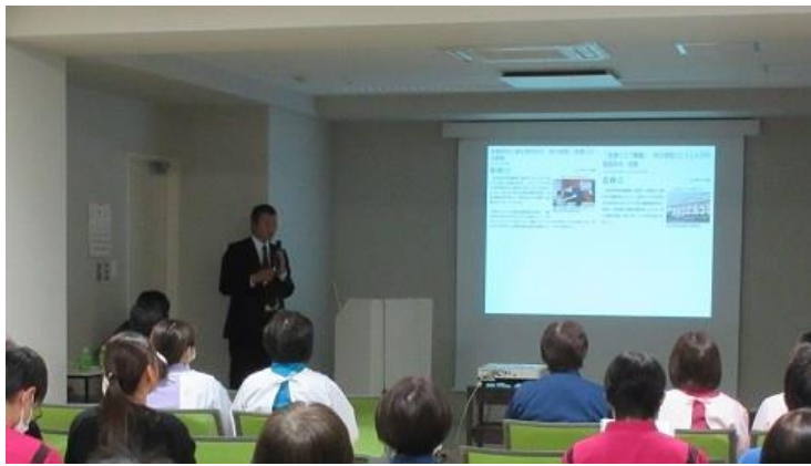
4回の中の2回目。11月20日(水)午後4時の部。