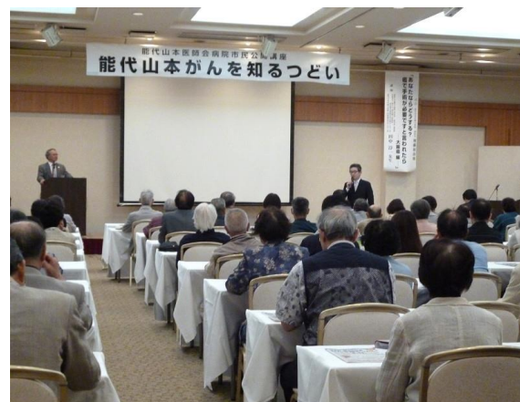
講演終了後は講師と来場者との質疑応答。