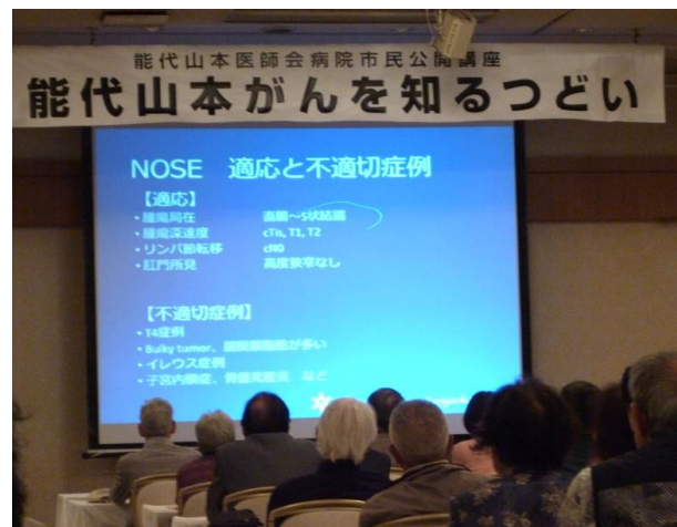
腹腔鏡下手技で切除したがんを肛門などから 摘出する手法NOSE。鮮明な画像も公開。