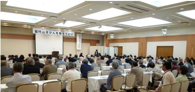
会場は医療関係者、一般市民200名ほどで満員となりました。