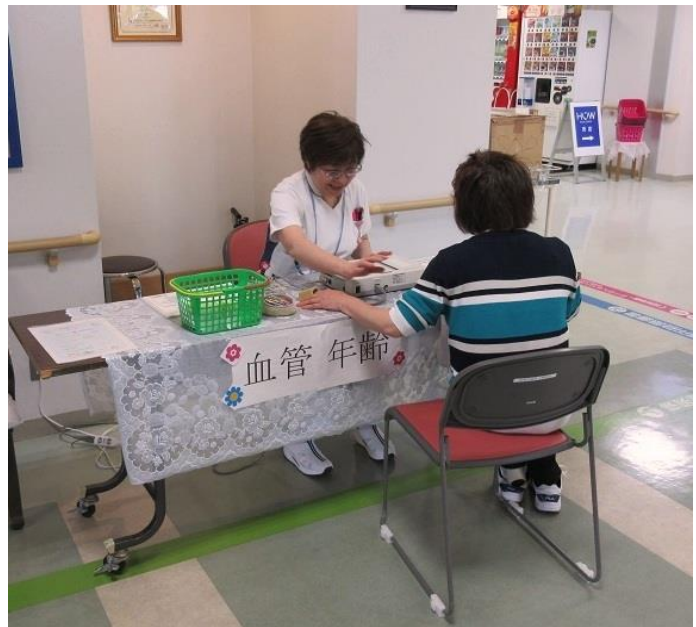
1F受付カウンターの迎えて、患者さんの血管年齢を測っています。