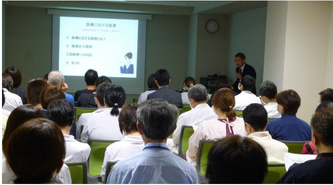
4回の内の1回目。11月15日(水)午後3時の部。