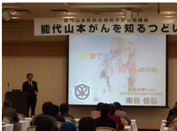
南谷先生の講義は「がんって何？」から始まりました。