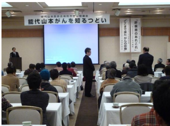
講演終了後に講師と来場者として質疑応答。