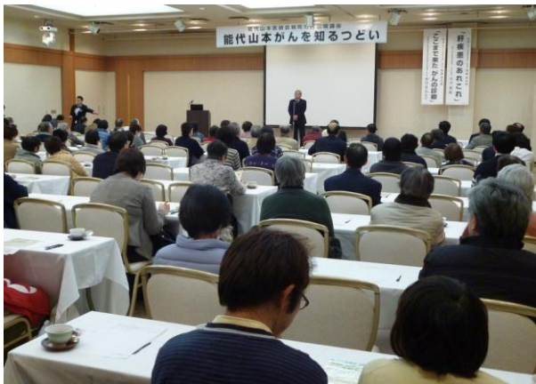
山須田医師会長の挨拶で開会。会場は医療関係者、一般市民200名ほどで満員となりました。