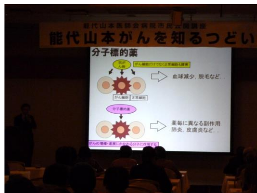
最新のがん診療について、話題のがん治療薬を解説。また、南谷先生ご自身が立ち上げている「がんになってもあきらめない！」活動も紹介されました。