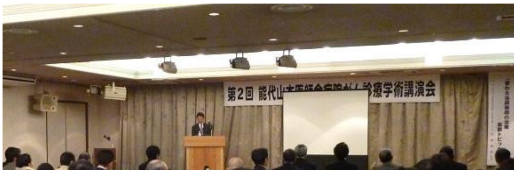
会場には約50人の医師等、医療従事者が出席。