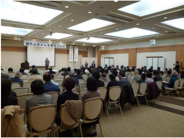
会場は医療関係者、一般市民で約200人ほどの参加。

平成28年11月6日(日) 13:00～16:00 能代山本医師会病院市民公開講座 『第2回能代山本がんを知るつどい』 がキャッスルホテル能代で開かれました。