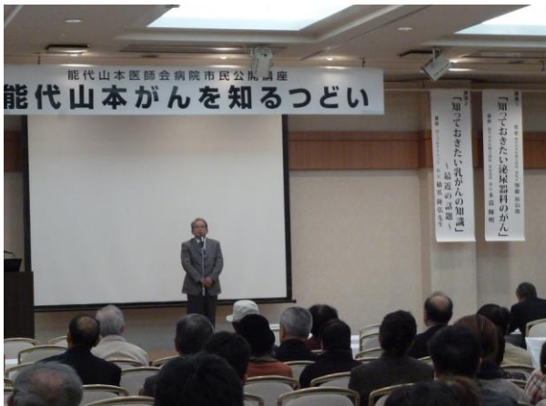
山須田医師会長の挨拶で開会。