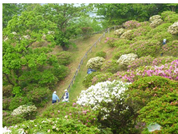
医師会病院の後側にある農水省選定「ため池百選」 小友沼。周辺に散策路とつつじゾーンがあります。