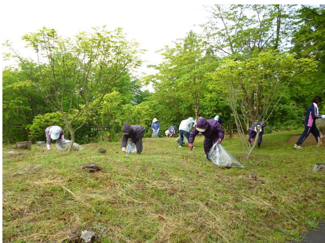
総会後はエリア内各施設の職員、地域の老人クラブ、医師会の 医師たちによるクリーンアップ。