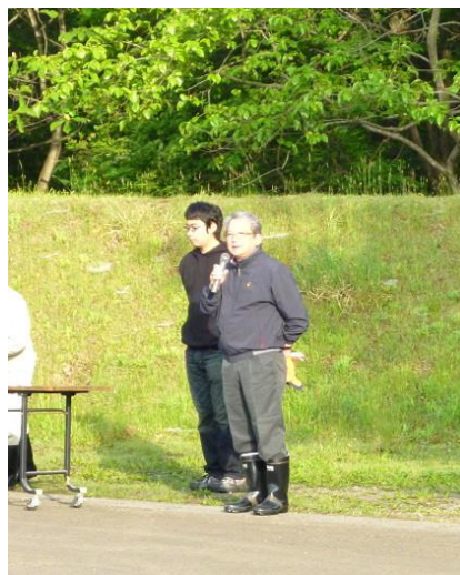
エリア会会長の山須田医師会長から 開会挨拶をいただきます。