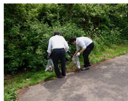
30分ほどの草取り、ごみ回収を終え て、これからエリアは夏を迎えます。