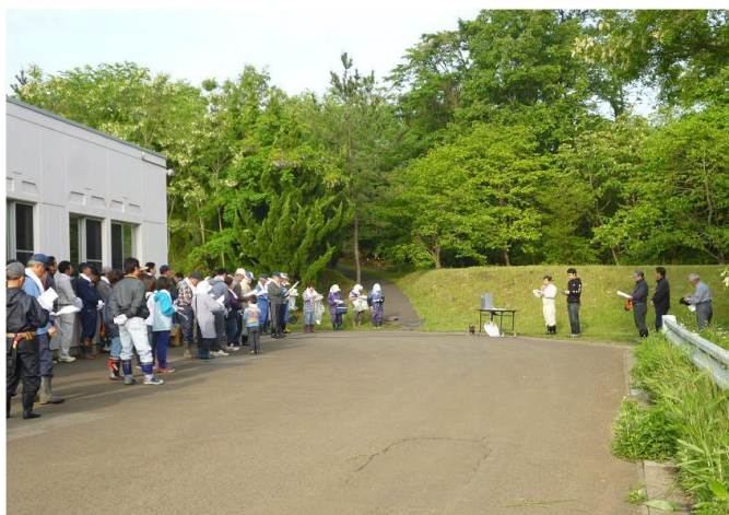
初夏まだ肌寒い早朝午前6時。 エリア内施設「友楽苑」裏 散策路入口に全員集合。

平成28年5月28日(土)午前6時から能代山本医療福祉総合エリア内で「能代山本医療福祉総合エリアを守り育てる友の会」の平成27年度総会とクリーンアップが行われました。 同会は、エリアの環境を守り育てるために平成4年に立ち上げられたボランティア団体。 当医師会病院が事務局です。