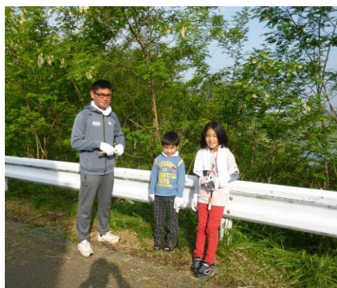
お父さんと一緒に、楽しいクリーンアップ。