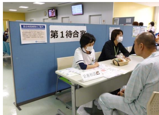
管理栄養士による栄養相談コーナー