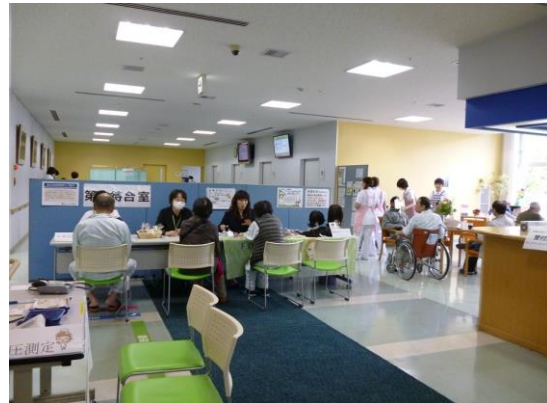
受付カウンターのそば、1F外来ホールで開催