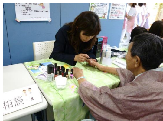
おしゃれな爪補強用マニキュアをお試しください