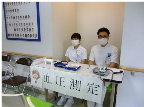
血圧測定してみませんか