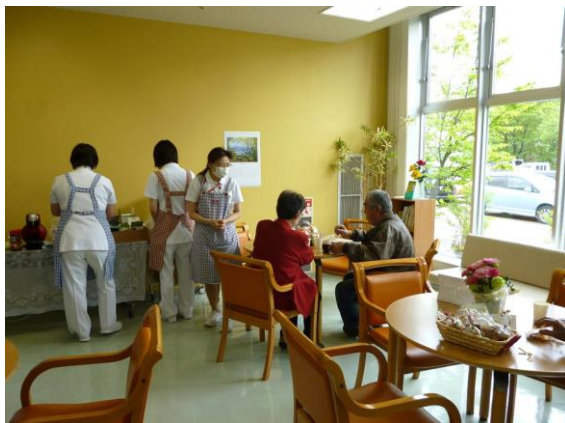
喫茶コーナーで無料のコーヒーとお菓子を