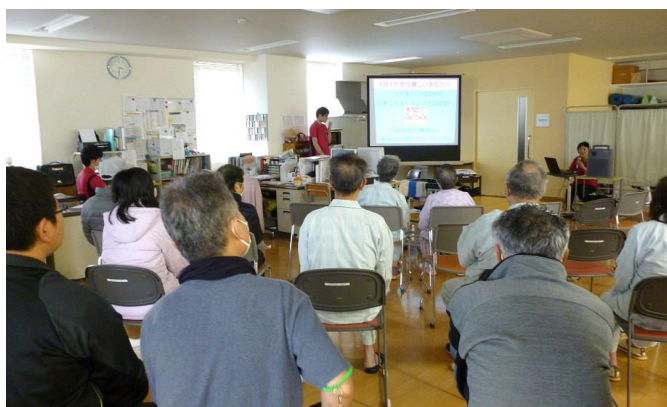
2型糖尿病における運動療法のさまざまな効果。 そのメカニズムがわかりやすく解説されました。