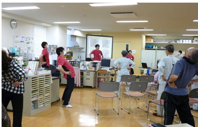
始めにさっそく、できる方々で、軽くラジオ体操を。