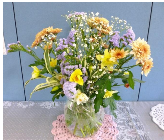
栄養科「5月に向かって」