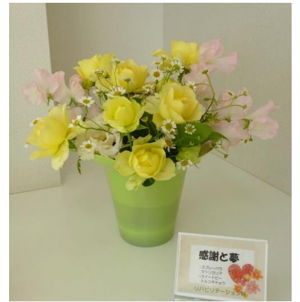
リハビリ科「感謝と夢」