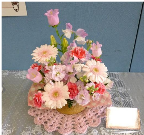
外来看護科「スタート」

毎月第1月曜日に病院内に各部署が花を飾り、患者さんはもちろん来院者や職員にも楽しんでいただいております。