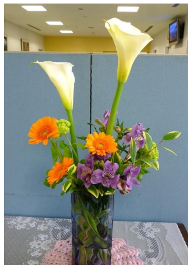
放射線科「春の便り」