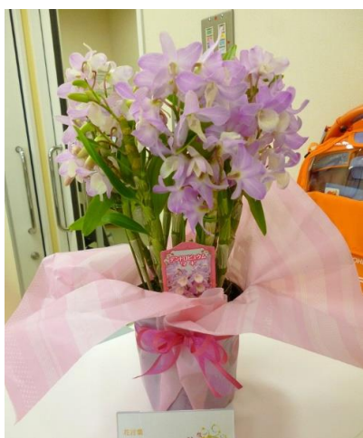
歯科口腔外科 「花言葉 わがままな美人」