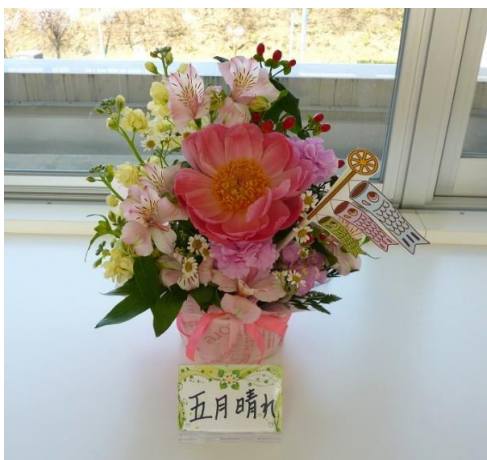
2F西看護科「五月晴れ」