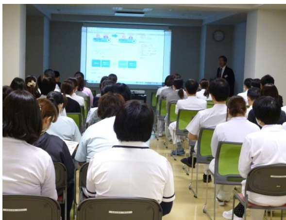
4回の内の1回目。11月8日(火)午後3時の部。