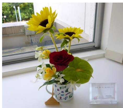
2F東看護科 「8月 暑い暑い夏が来ました！」