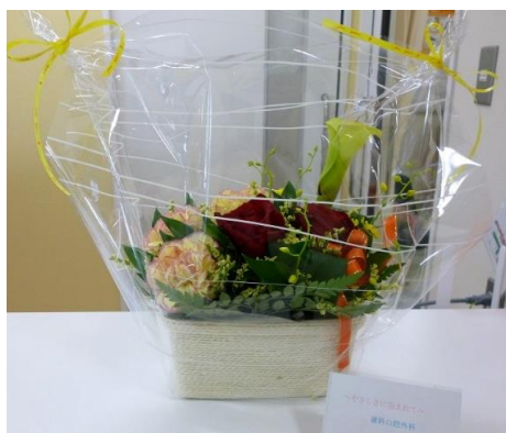
歯科口腔外科 「やさしさに包まれて」