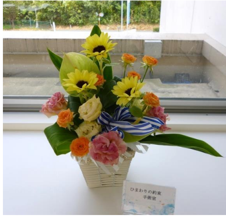
手術室「ひまわりの約束」