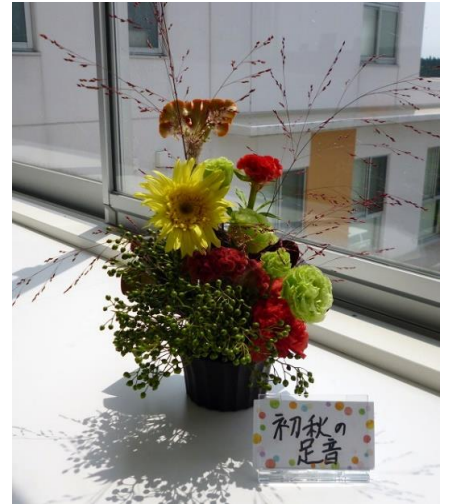
看護助手「初秋の足音」