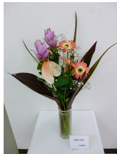
放射線科「真夏の太陽」