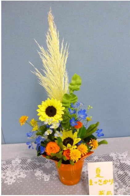
薬局「夏まっさかり」