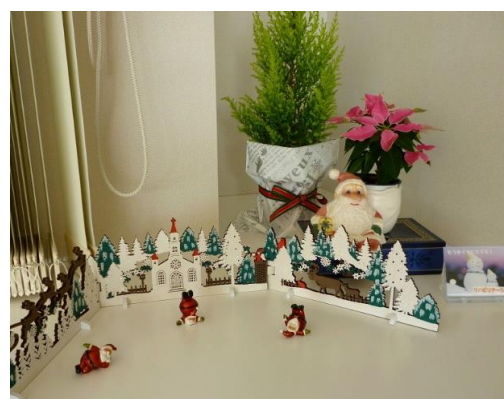
リハビリ科 「もうすぐクリスマス！」