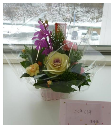
清掃課「ゆく年くる年」