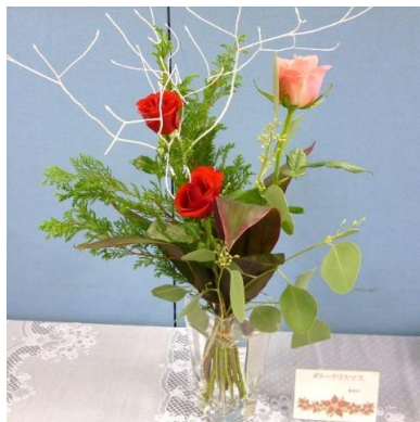
薬局「メリークリスマス」