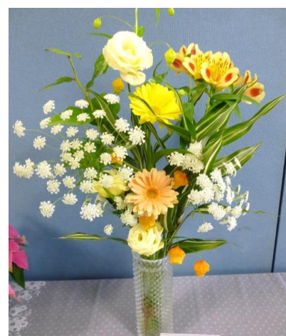
放射線科 「Winter again」