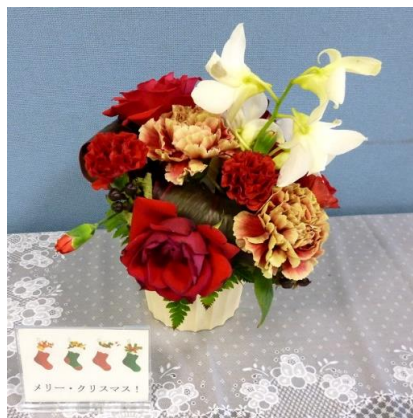
外来看護科 「メリー・クリスマス！」

毎月第1月曜日に病院内に各部署が花を飾り、患者さんはもちろん来院者や職員にも楽しんでいただいております。