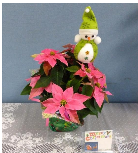
歯科口腔外科 「Merry Christmas！」