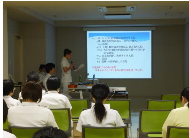
看護科から症例の入院経過説明。