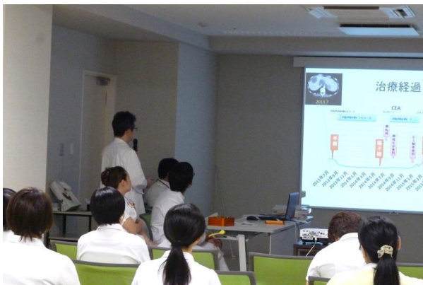
主治医から治療経過説明。

テーマは 『大腸癌終末期に転院を希望されたが果たせなかった1症例』 終末期に地元の病院への転院を希望されたが状況不良で叶 なかった症例です。 日中の勤務を終えた職員が集まりました。