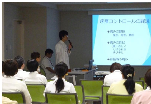
薬剤科から疼痛コントロールの経過説明。